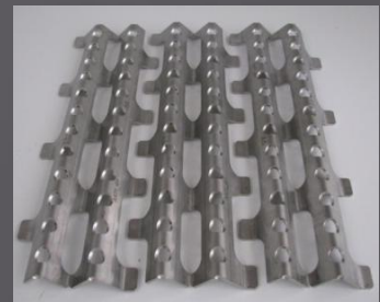
3-lohkoa levennetty leveys 440mm