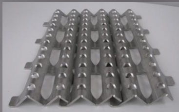
3-lohkoa tiivistetty leveys 340mm