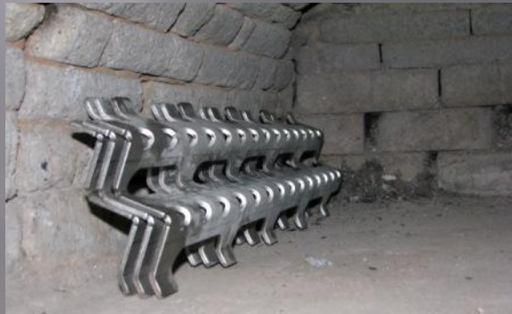
Aalto - Arinat nostettu seinustalle

Puhdistaminen tapahtuu, joko imuroimalla tai sitten, että nostellaan arinat uunin sivuseinustalle limitän ja harjataan tuhkat pois