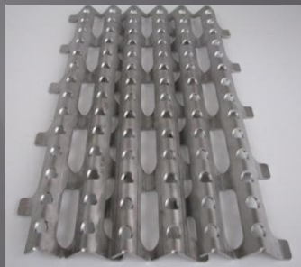
3-lohkoa tiivistetty leveys 340mm